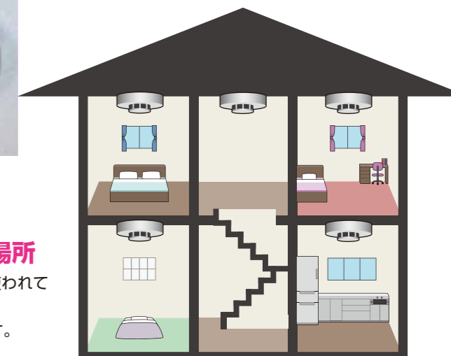
住宅内取付位置図