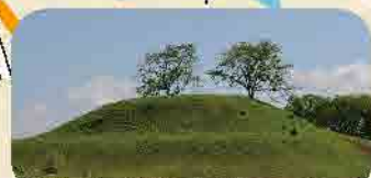
日本一の方墳 岩屋古墳