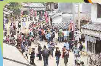
千葉県立房総のむら