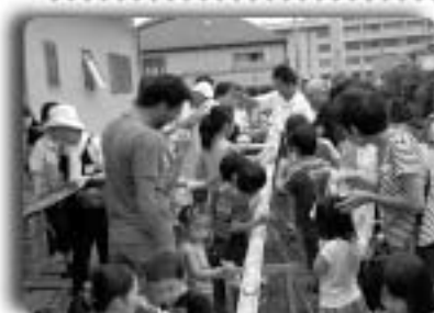
▲地域の交流を楽しみながらのそうめん流し