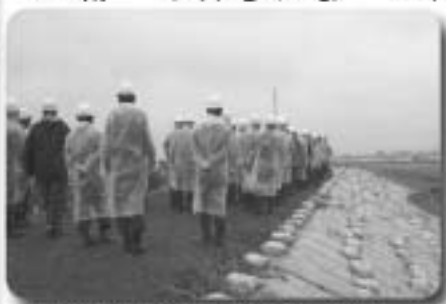
▲被災した堤防を巡視する消防団員

当日は小雨の降る中、国土交通省職員による現状説明および、巡視ポイントの説明が行われました。