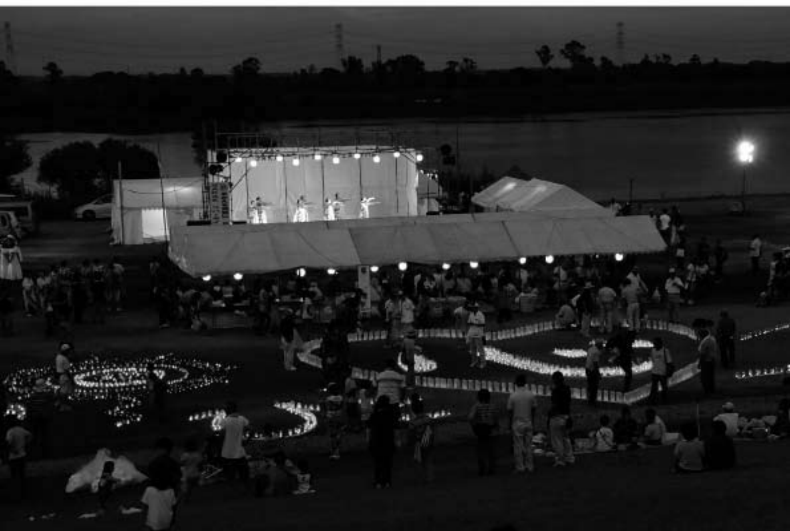
▲夕闇に浮かび上がるキャンドルメッセージ【心ひとつに】では、来場した多くの観客を魅了 SAKAEリバーサイドフェスティバルより【関連記事：8～9頁】