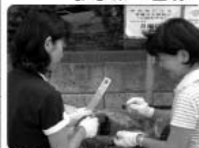
▲不適ごみを分別する 廃棄物減量等推進員

栄町廃棄物減量等推進員制度は、ごみの分別および減量化の推進や、ごみ集積所の適正な利用に関する指導などに取り組みものです。現在、左表の名簿の方がたが、地域の廃棄物減量のためのリーダーとして、地域の皆さんのご協力をいただきながら、活躍しています。 なお、任期は平成25年6月30日までです。問合せ 環境課 (☎133) へ。