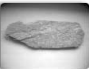
が暮らしていたのです。

形は文字通り板状で、上部は三角形、如来や菩薩などの仏様を梵字や画像で表し、紀年銘や供養者名などが刻まれています。秩父・長瀨地方で産出する緑泥片岩製のものを武蔵型、筑波山で産出する黒雲母片岩製のものを下総型と呼びます。鎌倉時代～戦国時代に盛行しますが、安土桃山時代には減少し、江戸時代にはなくなってしまう。つまり、板碑は戦乱の絶えない時代に武士階級によって造られたものと考えられ、常に死と直面していた当時の武士の信仰、思想を反映しているといえます。 栄町では、武蔵型・下総型の両方が確認されています。酒直地区には、正中2年(1325年・鎌倉時代、正中の変の翌年)の武蔵型板碑、延文4年(1359年・室町時代)の武蔵型板碑、龍角寺地区には、元弘3年(1333年・鎌倉幕府滅亡)の武蔵型板碑があります。また安食地区では、数点の下総型板碑が見つかっています。 往時の栄町には、間違いない戦乱を生きた、武士達が多量に造られていたのが暮らしていたのです。