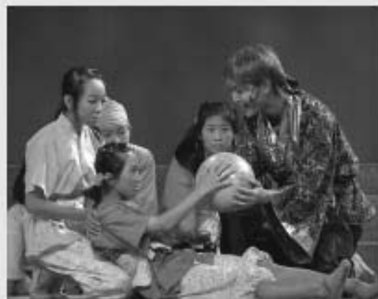
▲7月31日に公演した市民ミュージカル「優しい薔の物語」のワンシーン