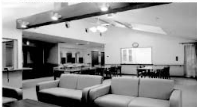
印旛郡栄町竜角寺台 4-18-1