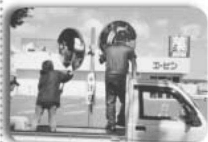
▲ドラッグストア前のカーブミラーを清掃する安全協会の皆さん

交通事故を防止するため、7月に印西交通安全協会布録支部と成田交通安全協会安食支部の皆さんで、それぞれの管轄地域のカーブミラーの清掃と点検・樹木の伐採を実施しました。