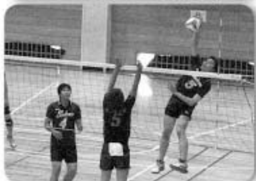
▲男女共に3位に入賞した バレーボール