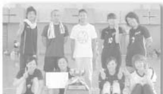
▲優勝した「クワーズB」