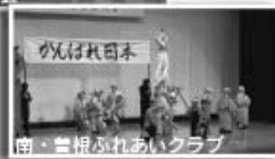
南・曾根ふれあいクラブ