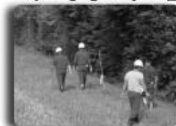
▲堤防を巡回する消防団員

利根川の堤防は3月に発生した東日本大震災の影響により被災し、基準水位が見直され、2・75mではん濫注意水位となりました。そのため、消防団長をはじめとする消防団員が、被災箇所を重点的に堤防の巡視を実施しました。