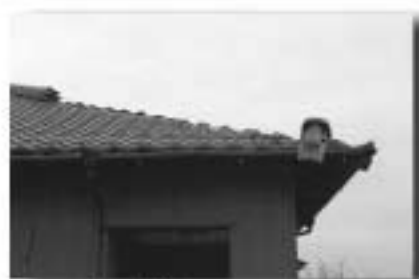
▲瓦が一部落下した屋根

※義援金の額については、申込み者数によって配分される額が変わりますので、ご了承ください。 問合せ 義援金配分制度に関すること：千葉県防災危機管理課 政策調整班（☎043-223-2163） り災証明書（一部損壊を含む）に関すること：税務課資産税班（☎203-） 義援金申請に関すること：福祉課厚生高齢者班（☎140）または消防本部消防防災課（☎0119）へ。