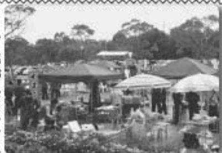
▲昨年のふれあいまつりの様子