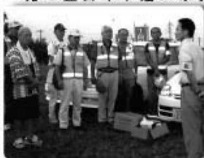
▲防犯パトロールに向け注意事項を確認する防犯指導員

各地区から推薦された防犯指導員が、成田・印西両警察署と合同で、防犯パトロールを実施しました。成田防犯連合会防犯指導員栄町部会は7月末に酒直台地区を、また印西警察署管内防犯組合連合会栄町支部は、8月末に南ヶ丘地区を、それぞれ夏まつりの当日に防犯パトロールと啓発活動を実施しました。