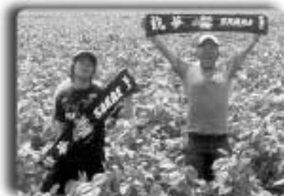
▲黒大豆の圃場で作業する ゴールデンボーイズのふたり

千葉県が加盟している JOIN (移住・交流推進機構) の法人会員である吉本興業グループでは、47 都道府県にお笑い芸人を住ませ、笑いを通して地域活性化