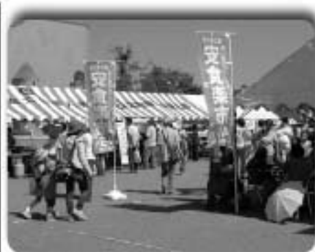
▲昨年の楽市の様子

手作りマーケット「安食の楽市で45円(始終ご縁)」を開催します。このイベントは、栄町とその近隣地域に住んでいる方がたといっしょに、新たな地域交流の仕組みを作り、地域経済の活性化を目的として行うイベントです。名前の由来は、この地域の活力の要素を欲張ってすべてこのイベントの標語にしました。「安心、安全、安楽の食卓、楽しい市