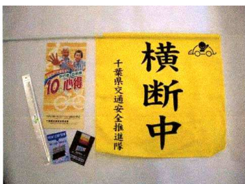
街頭活動用に貸与される横断旗

※その他…ロッカーやレターケースを利用する団体・情報を届けてくれるために来所など