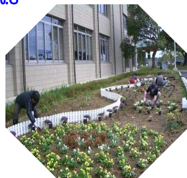
フラワーサミット(Fサミット)誕生！