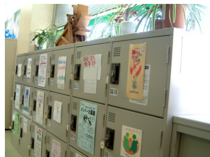
※ロッカーの扉には、団体の PR チラシが 掲示できます！