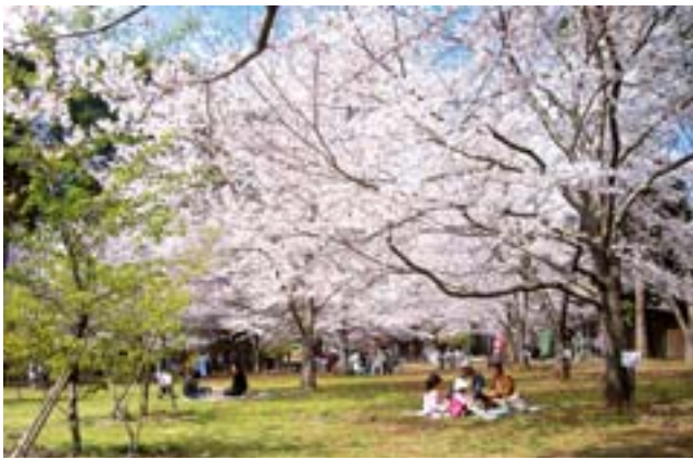
ドラムの里のサクラ