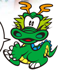
房総のむらで遊ぶ