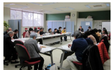
★施策勉強会 「栄町の福祉サービス」について