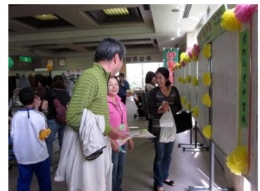
★住民活動ふれあいまつり 展示ロビーの様子