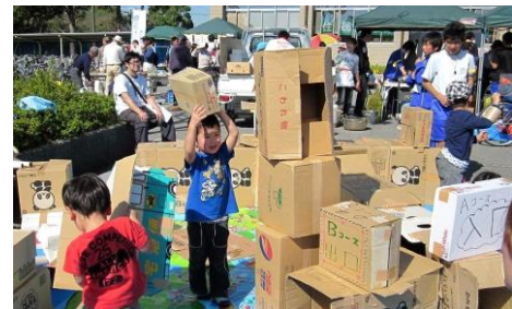
ダンボールで自由に遊ぶ子ども達

もったいない陶器市は陶器をゴミではなく再利用(リユース)してゴミ減量を目指すものです。多くの町民の方の協力で約300kgの陶器が集まり、再利用するために当日持ち帰りしていただきました。「市」に設置した東日本震災の義援金に沢山の協力があり、福島県のNPOを通してお正月用のもち米(栄町産)60kgを被災地に送ります。ありがとうございました。