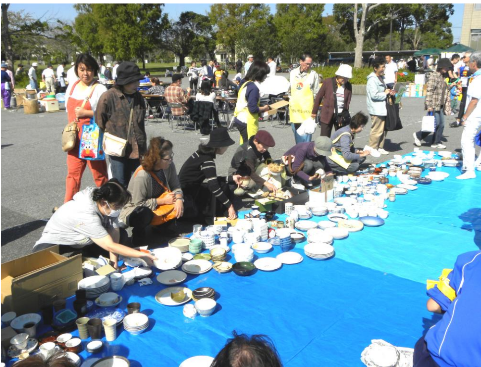
もったいない陶器市