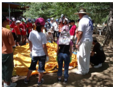
昨年の様子(テント設営)