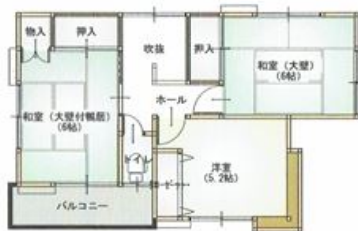
2階 平面図 S:1/100