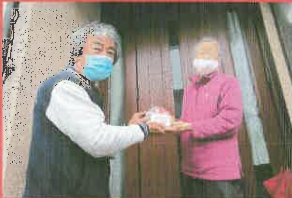
コロナの影響で孤立傾向にある 高齢者宅への訪問事業