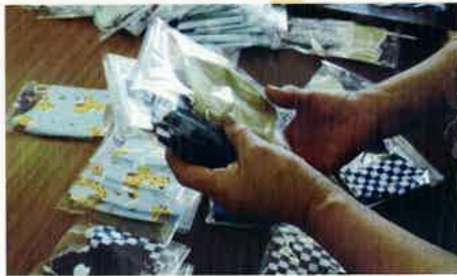
ひとり暮らしの高齢者への見守りを兼ね、手作りマスクを配布しました。(山武市)