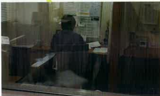
相談者の方の声に寄り添い、自殺を防ぎいのちを守る活動を行っています。(千葉市)