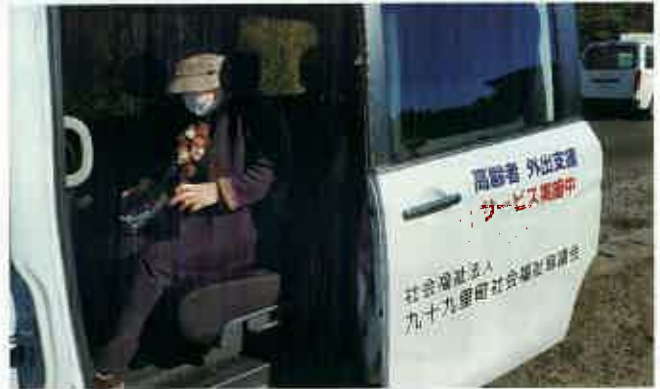
交通手段の乏しい地域に住む高齢者の、通院・買い物を支援しました。(九十九里町)