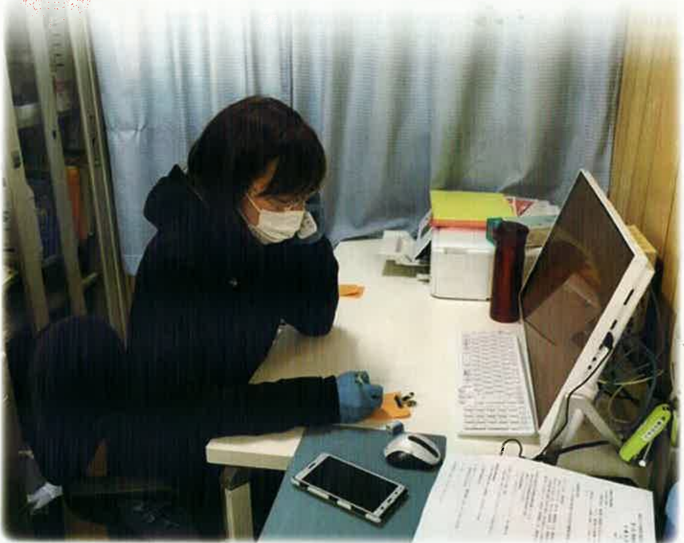
電話による高齢者の安否確認「お元気ですか？コール」(白井市)