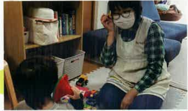
子育てのお手伝いが必要な家庭を訪問し、悩みを聞いたり一緒に外出して子育てのサポートをしています。(市川市)