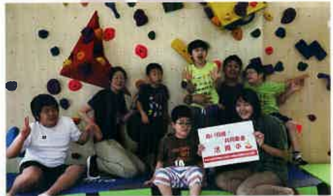
障がいをもつ子どもにも効果的であるとされる運動を室内でもできるように療育設備を整備しました。(流山市)