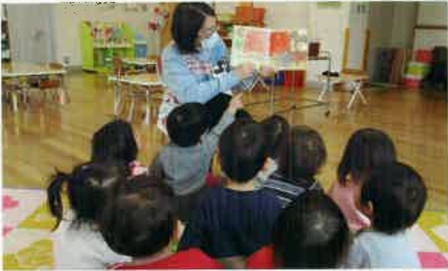
室内で過ごす時間が増える子どもたちへ、絵本の贈呈を行いました。(南房総市)