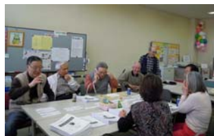
交流サロンの様子