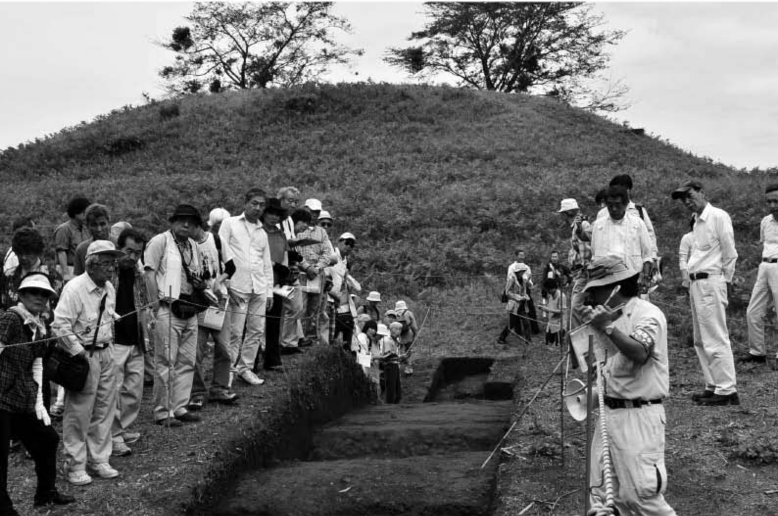
▲6月19日、国指定史跡「岩屋古墳」の第2次発掘調査が行われ、GPS（全地球測位システム）観測により、古墳本来の規模が東西108.108m、南北96.604mと計測され、規模の明らかな方墳では、日本最大ということが判明しました。また6月23日には、調査結果の現地説明会を開催し、歴史に興味のある多くのかたが訪れました

【岩屋古墳 交通アクセス】 成田ICから車で約20分・JR安食駅からバス (房総のむら下車) 10分徒歩5分