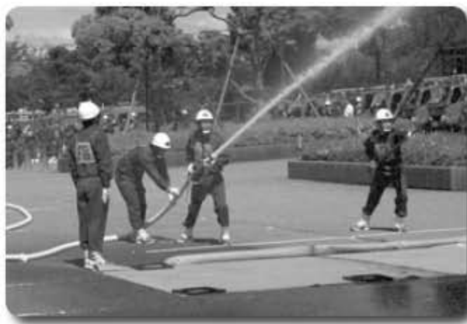
▲日々の練習の成果を披露する消防団員