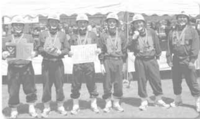
▲第3位に輝いた第1分団第1部の団員たち