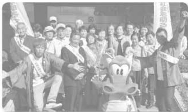
▲役場玄関前での出発式