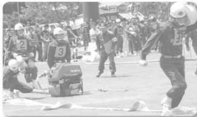
▲小型ポンプの部に出場した第1分団第3部