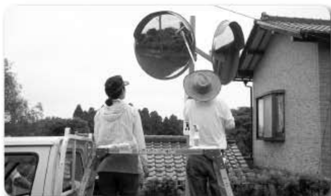
▲カーブミラーを清掃する安全協会の役員