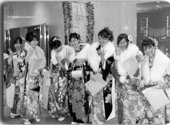
▲野菜で作った宝船の前で記念撮影