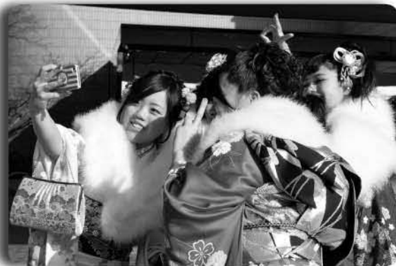
▲久しぶりに合う友だち同士で仲良く