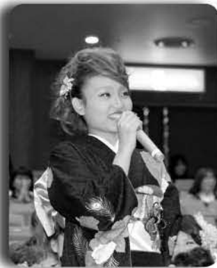
▶実行委員企画のインタビューでは、新成人としての将来の夢や近況を報告