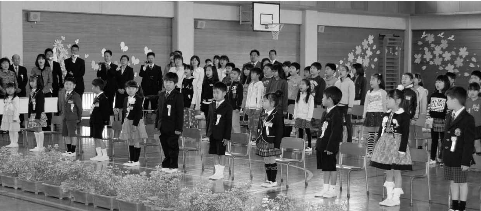
▲北辺田小学校同様に統廃合前の最後となる酒直小学校では、11人が入学し名前を呼ばれた児童たちは緊張しながらも元気いっぱい返事をしていました【撮影：4月8日】