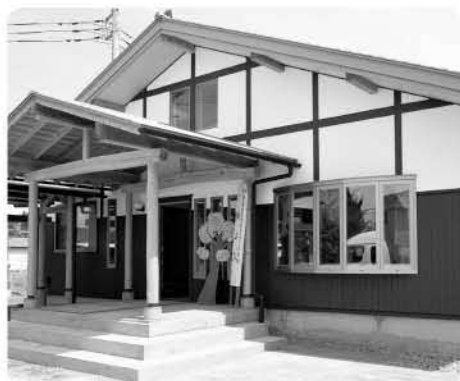
▲竣工した児童発達支援センター安食

児童発達支援センター安食が竣工 児童発達支援センター安食（社会福祉法人印旛福祉会）が旧保健センター跡地に開設し、4 月 2 日に竣工式が行われました。 児童発達支援センターでは、発達に不安のあるお子さんを通所による療育や、特別支援学校などの終了後や休業日に通所による社会との交流の促進などの事業を行います。 なお、これに伴い、町が安食台小学校で運営していた栄町簡易マザーズホームは 3 月末で事業を終了し廃止しました。