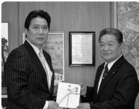
▲藤本理事長より目録が贈呈

町長は、「毎年度継続して寄贈していただき大変感謝いたします。大切に使用させていただきます。」と感謝の言葉を述べました。