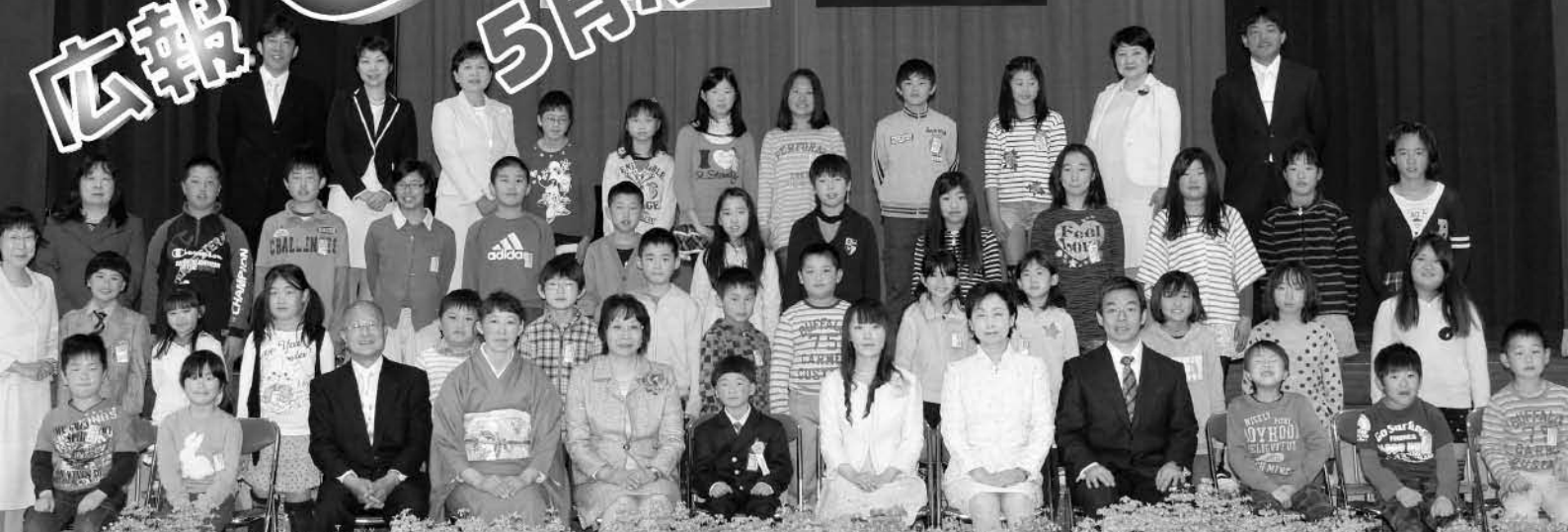
▲統廃合前の最後となる北辺田小学校の入学式では、今年入学した児童や保護者を囲み全校生徒および教職員たちによる記念撮影が行われました【撮影：4月8日】