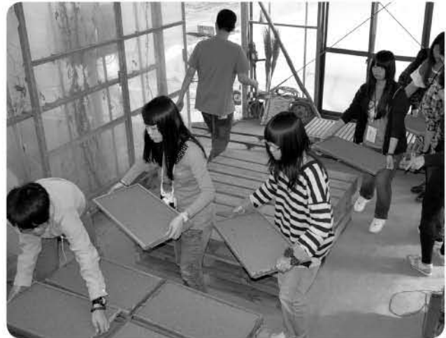
▲農業体験をする生徒たち

24 日には、農業体験として稲作の種まきや太巻き寿司の調理など日本の伝統や文化に触れ、その日の夜は、町内の受け入れ先の家庭で一夜を過ごし、それぞれの家族からおもてなしを受けるなど、日本での楽しい思い出を作りました。