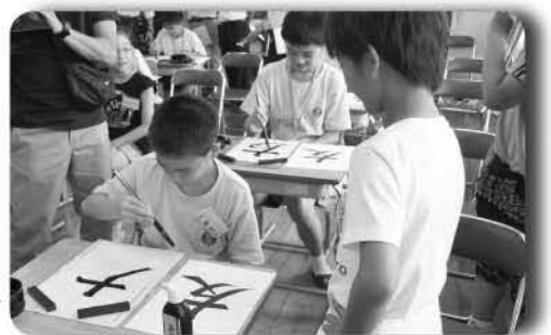
▲真剣に書写する台湾の児童

「友」の作品を仕上げ、育館で、混合チームによるユニカールで汗を流し、給食をいっしょに食べました。短い時間で、身振り手振りで話し、楽しい交流ができました。