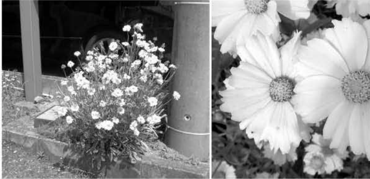
▲道路端に咲く「オオキンケイギク」(写真右は拡大したもの)

町では、道端などの管理地については、管理作業にあわせ職員などが駆除を行っています。