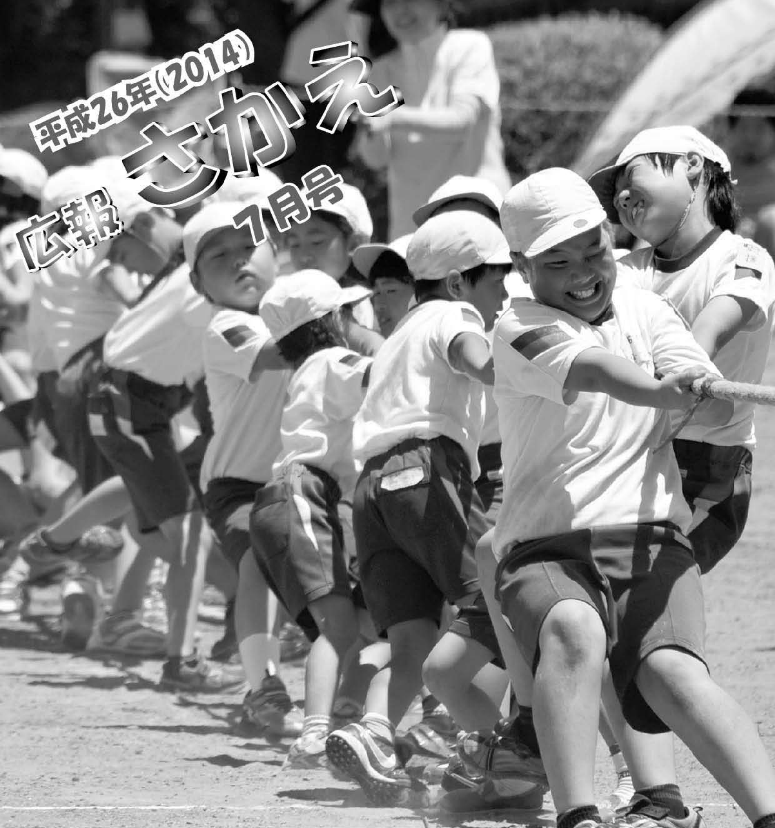
▲力いっぱい綱を引く姿にたのもしさと強い絆が感じられた統廃合前最後となった北辺田小学校の運動会