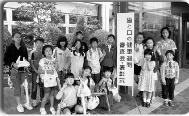
歯と口の健康週間 審査会・表彰式

6月5日、成田市で印旛郡市の歯と口の健康審査会が行われ、各部門で多くのかたが優秀な成績で表彰されました。