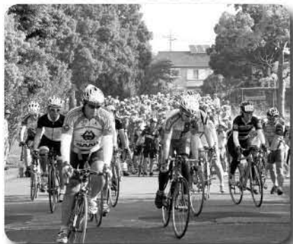
▲勢いよくスタートする参加者たち

千葉県サイクリング協会主催の第10回跳子センチュリーライド2014は、6月1日、ふれあいプラザさかえをスタートして、北総の大地と太平洋の雄大な景観の中、400名の参加者が1周160kmを走りぬけました。