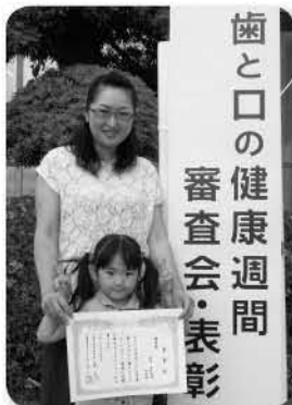
歯と口の健康週間 審査会・表彰