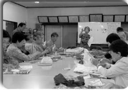
▲南ヶ丘自治会のサロンのようす

参加してくれるかたも増え、高齢者のかたの居場所づくりと言う点ではある程度定着してきたようです。ただ、開催日が平日なことや、メニュー構成などから、高齢者以外の参加までには至っていないことから、今後は、地域の人の交流の場としての意味合いを深めるためにも、土・日曜日を利用して地域の子どもたちとの交流を図ることや、特技や貴重な体験や知識を持ったかたなどの人材発掘を積極的にしていきたい、サロンの活性化が図られ「住み慣れた南ヶ丘で健康で楽しく暮らしていきたい。」そんな思いの手助けになるようなサロンに地域のかたみんなできていきいそうです。 なお、自治会では、サロン以外に今年度は高齢者対策・自主防災組織の強化の取組みをスタートさせているそうです。