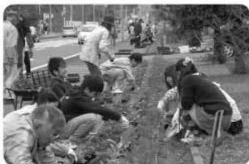
▲皆の手で町をきれいにしました

地域をきれいにするため、11月17日に地域の方がたや見守り隊・あおぞら会を中心に、学校支援ボランティア・保護者のサポートのもと、竜角寺台小学校の5年生・6年生の児童が、成田西陵高校の生徒と協力し学校内花壇や竜角寺台のバイパスに、パンジーや葉牡丹、きんせんか、ピオラなどを植えました。