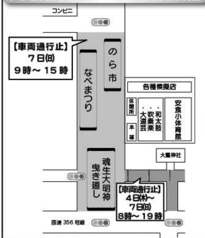
いっさいがっさいフェスティバル会場案内図