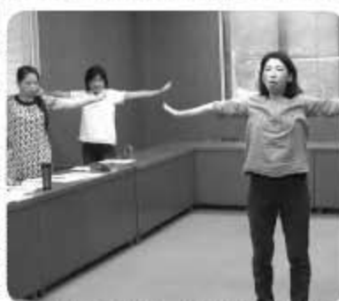
▲完成を目指して練習中です

町の龍伝説と岩屋古墳をモチーフとした体操で、今後、楽曲が付いた段階で、有志の団体に試していただき修正を加え、来年6月の完成を目指しています。