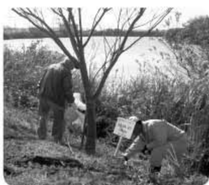
▲長門川沿いを清掃しました

長門川（印旛沼）は、私たちにさまざまな恵みを与えてくれる財産です。ゴミのポイ捨ては絶対にしてはならず、必ず持ち帰りましょう。