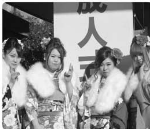
▲栄町の未来を担う新成人たち