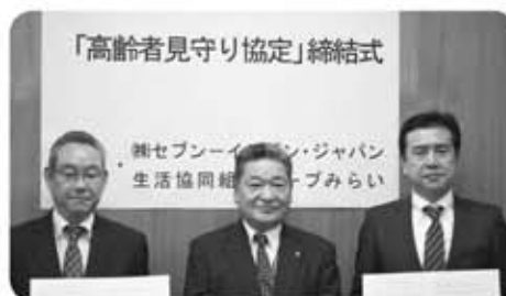
▲協定書締結の様子

町と(株)セブン・イレブン・ジャパンおよび生活協同組合コープみらいは、1 月 15 日に、高齢者に対する見守り・安否確認体制の充実を図るものとして、高齢者の見守り活動に関する協定を締結しました。