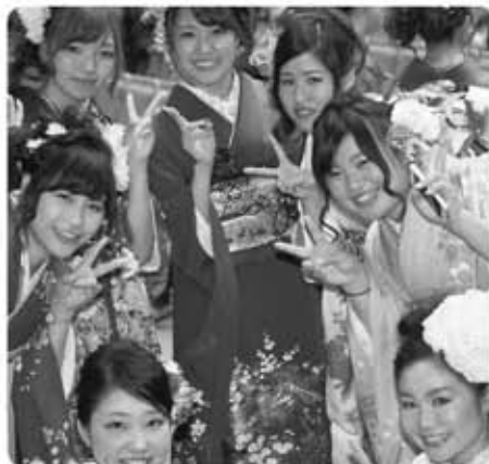
▲私たちいつまでも仲間だよ