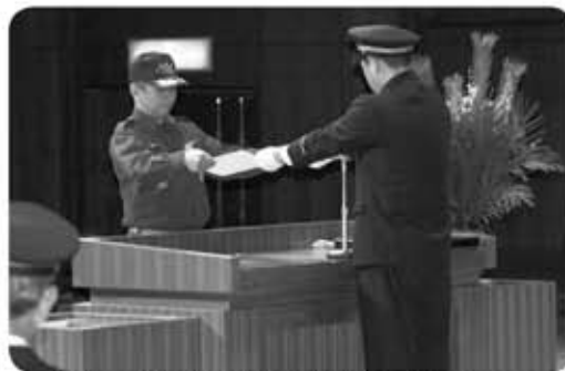
▲長年の活動に対し感謝状を贈呈

1月10日、ふれあいプラザさかえ文化ホールで、消防団員が一堂に集い新春恒例の消防出初式が挙行されました。