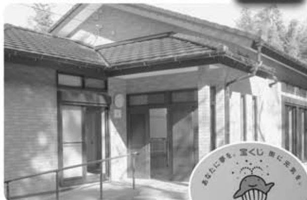
▲地区活動の拠点が完成

新しい集会所はバリアフリーの設備も充実し、地区の活動をはじめ、様々な地域コミュニティ活動の拠点としてまた、災害時には避難所として利用されます。