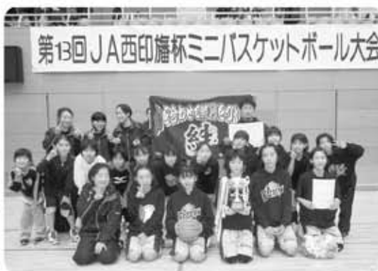
▲『絆』のちからで見事優勝しました

12月20日・21日に、松山下運動公園（印西市）で第13回JA西印旗杯ミニバスケットボール大会が開催され、印西市・白井市・栄町の3市町より男女24チーム350名が参加し、熱戦が繰り広げられました。