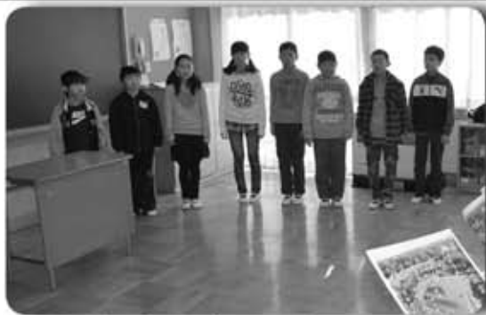
▲6年生に続いて全員で唱和

町教育委員会では、栄町の子ども達の家族を愛し、郷土や国を誇りに思う心を育成するため、会津藩の「仕の掟」の「ならぬものはならぬ」の精神を、現代の家庭教育の指針として広く福島県会津若松市で実践している「あいづっこ宣言」を手本として「栄っこ宣言」を策定し、今年3月末で閉校となる酒直小学校の児童たちが3学期の始業式で、「人をいたわります」「ひきようなことはしません」など五つの行動規範を唱和し、大きな声で「夢に向かってがんばります」と元氣いっぱい宣言しました。 この「栄っこ宣言」は、幼少期にこの宣言を覚え、青少年期を通して五つの行動規範を心の糧として夢に向かってがんばり、ふるさと「栄町」を愛し、もつと良くするためにとの想いが込められています。