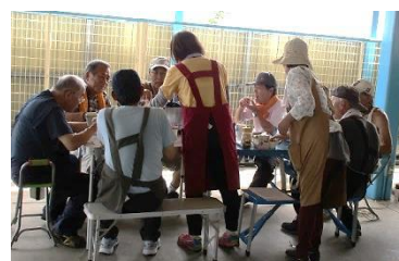
お茶タイムは楽しみ!