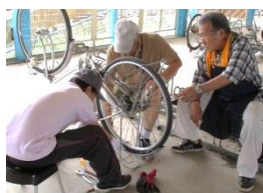
どこが悪いのかな