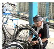
ギアかなあ・・・