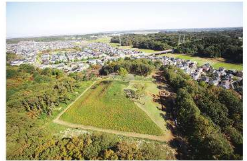
日本最大級の方墳岩屋古墳 100基以上からなる龍角寺古墳群の内、78基の古墳が敷地内に点在。中でも、現存する方墳では日本一の規模とされているのが岩屋古墳。風土記の丘資料館には県内での出土品が保存・展示されている。