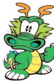
栄町イメージキャラクター 龍夢（ドラム）

毎年12月の初西の日を含む3日間に行われる「安食の西市」は、関東地方で最も遅い時期に開催される「西市」である。大鷲神社の例大祭期間中には、商運の熊手販売や、カラオケ発表会、和太鼓演奏、刃物研ぎなどが行われ、多くの参拝客で賑わう。