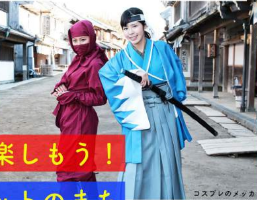
コスプレのメッカ