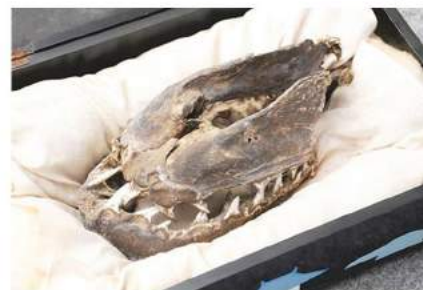
小龍の頭部のミイラ