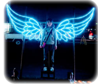
▲翼をモチーフにしたフォトスポット インスタ映えにぜひ!