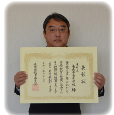
▲竜角寺台小学校校長先生