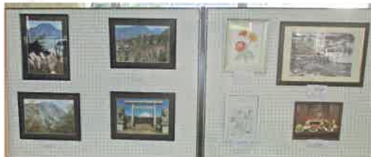
情緒豊かな写真や絵画