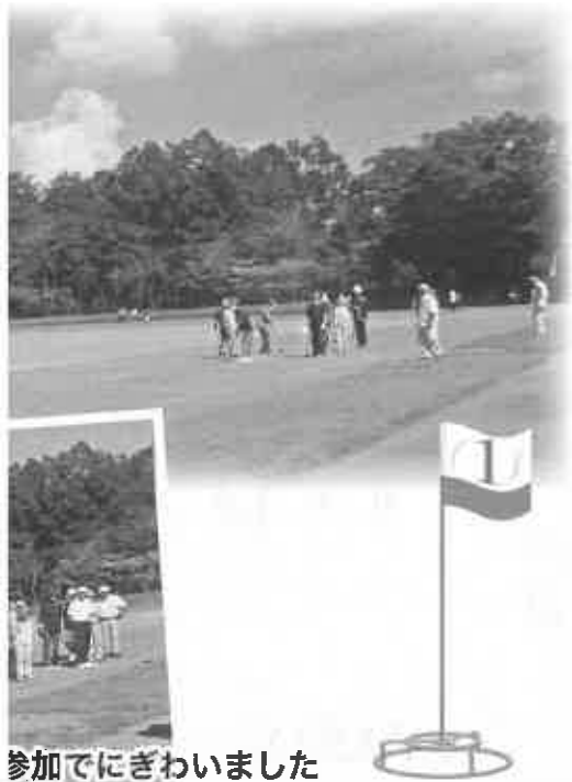
参加でにぎわいました