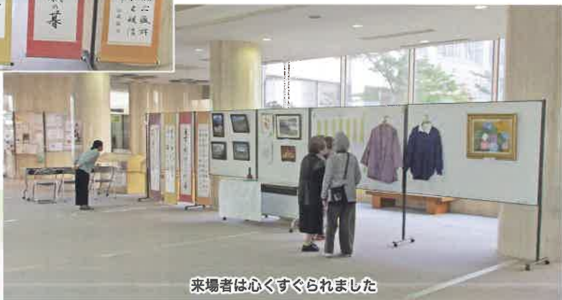
来場者は心くすぐられました