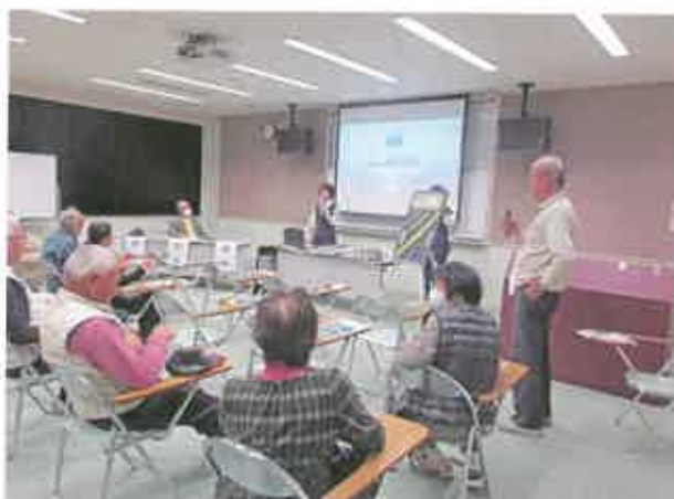
有意義な講座でした

事故を「起こさない・遭わない」ためには何が必要か、講話を聞く表情は真剣そのもの。参加者が実際に体を動かす場面もあり、楽しい学びの場となりました。