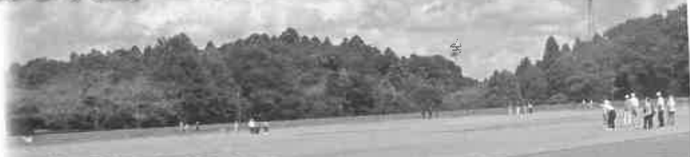
ゴルフ日和のお天気でした

9月13日(水)四街道市四街道総合公園多目的運動 場にて、印旛地区高齢者クラブ連合会グラウンド・ゴ ルフ大会が開催されました。