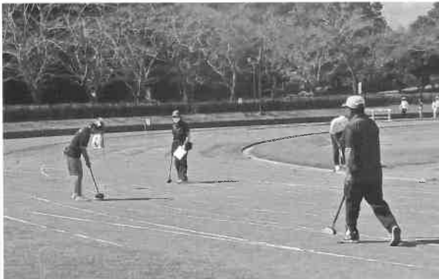
クラブを構え集中!