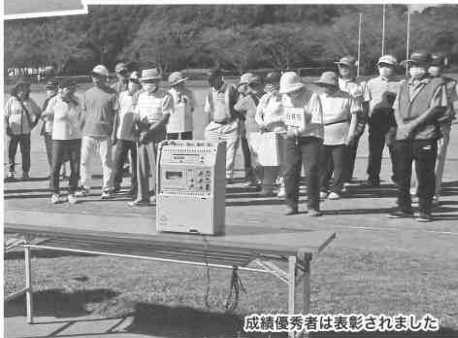
成績優秀者は表彰されました