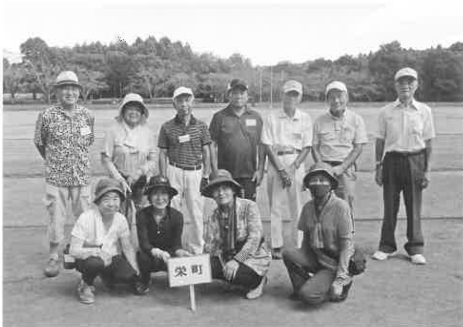
和気あいあいプレーしました