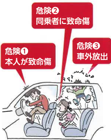
自動車後部座席同乗中死傷者のシートベルト着用・非着用別致死率【令和2年～令和6年】合計