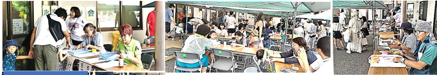
キャラクターすくい