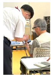
▲スマホ教室の風景